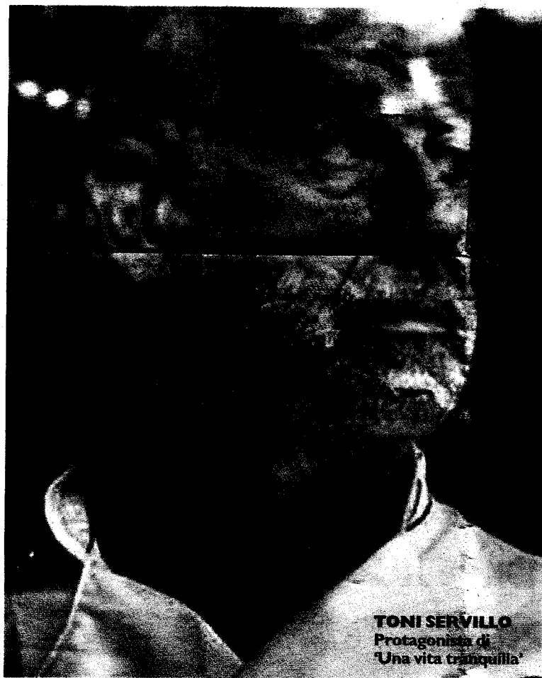
TONI SERVILLO Protagonista di 'Una vita tranquilla'

NUMERI importanti, capaci di stimolare l'interesse dello spettatore amante del bel cinema, attraverso il quale cerca anche e soprattutto storie diverse, vere, intriganti ed efficaci nel dare una risposta netta e chiara alla crisi della cultura che sta investendo il nostro paese sotto tutti i punti di vista. Una crisi che richiede una risposta im-