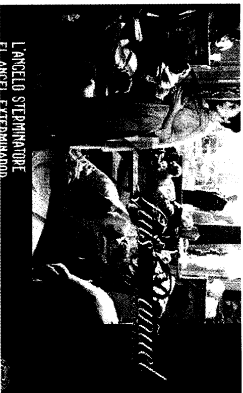
L'ANGELO STERMINATORE Dopo un concerto, un gruppo dell'alta borghesia si riunisce in un salone ma non può più uscirne...

La copertina del libretto-programma sa di storia del cinema: L'angelo sterminatore , pellicola del 1962 del regista Luis Buñuel, uno dei titoli più famosi e surrealisti del regista spagnolo, un vero atto